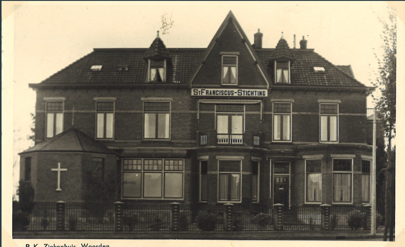
R. K. Ziekenhuis Weerden

1931 Het ziekenhuis wordt uitgebreid met een vleugel aan de andere zijde (nu nummer 54 A en B)