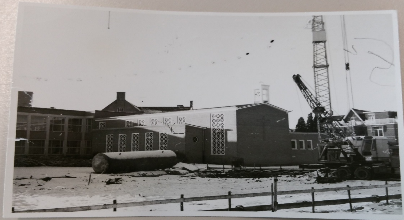
De nieuwe kapel bij Ope Dei wordt gebouwd in 1958