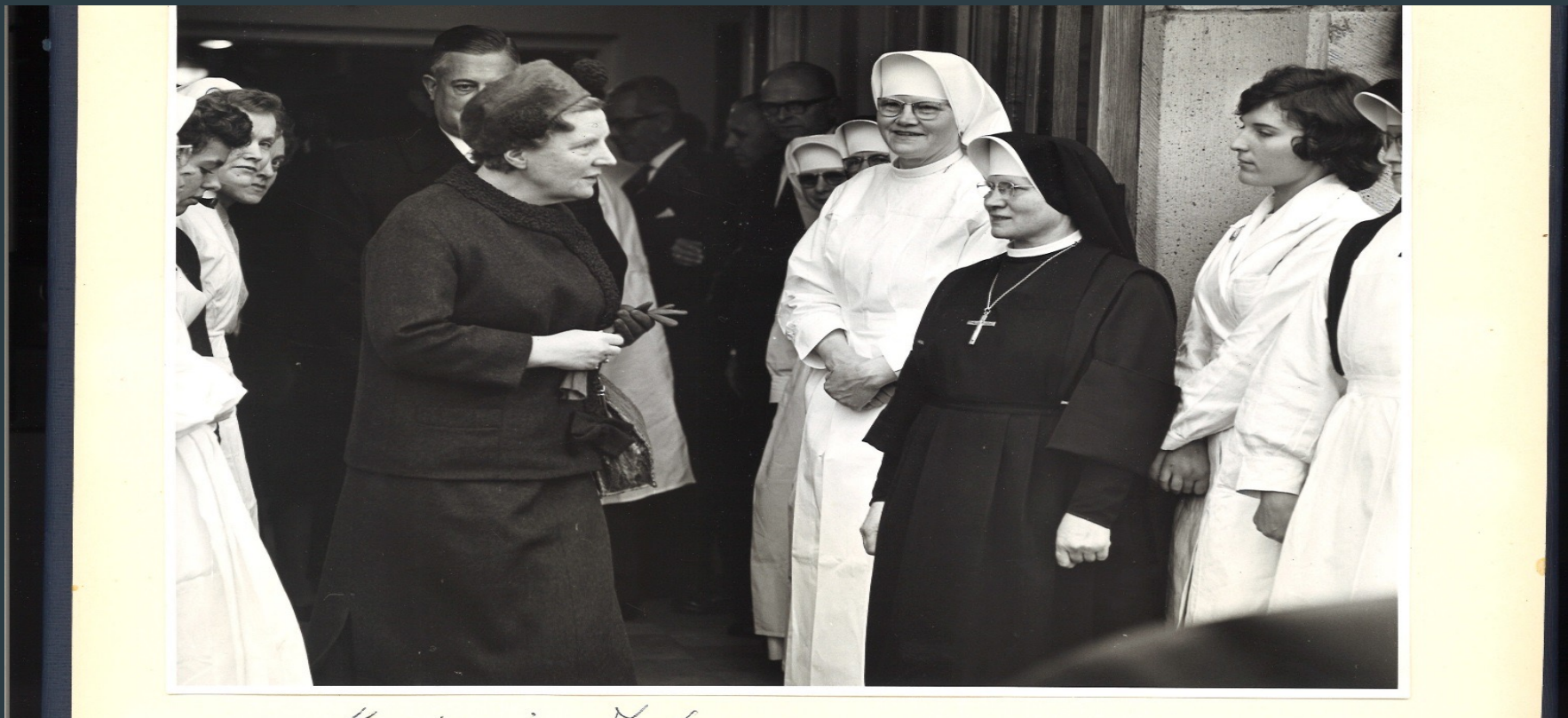
Bezoek H.M. Koningin Juliana aan Ope Dei na de spoorwegramp bij Harmelen 12 januari 1962