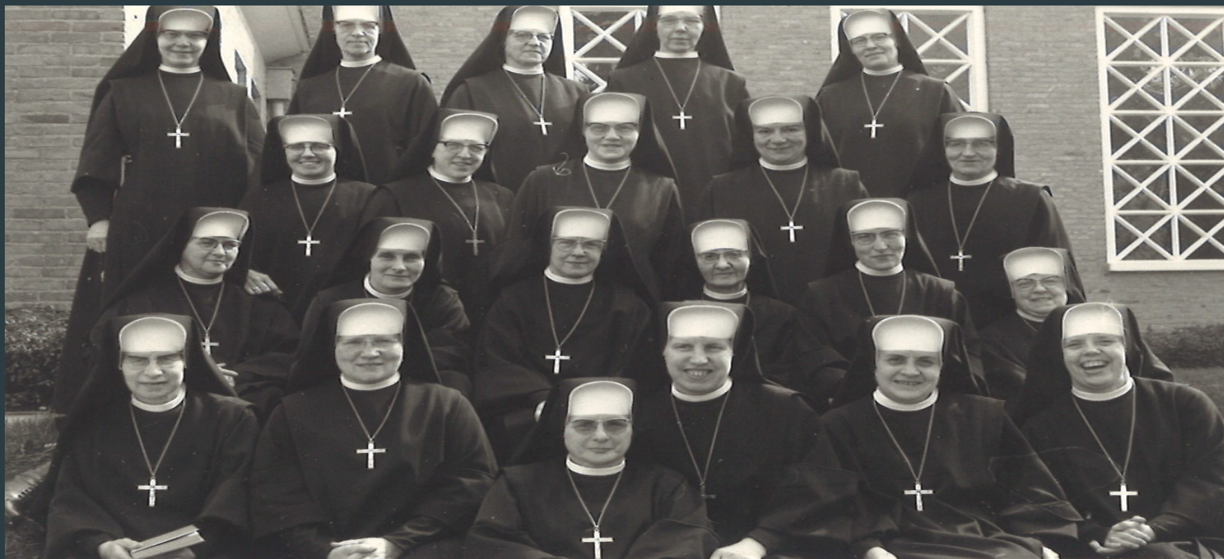
De communitie van de zusters in 1959. Wellicht enige bekenden voor U